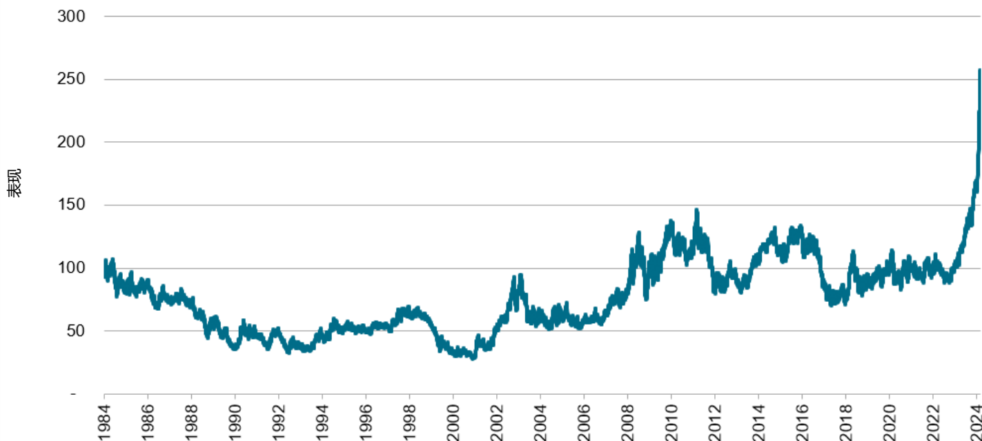
图表 2：标普高盛可可现货价格走高

数据截至 2024 年 2 月 29 日。标普高盛可可指数于 1991 年 5 月 1 日推出。过往表现并不能保证未来业绩。图表仅供说明，反映假设的历史表现。请参阅业绩披露（链接在本博文最后），了解与经过回测的业绩有关的固有限制的更多相关信息。