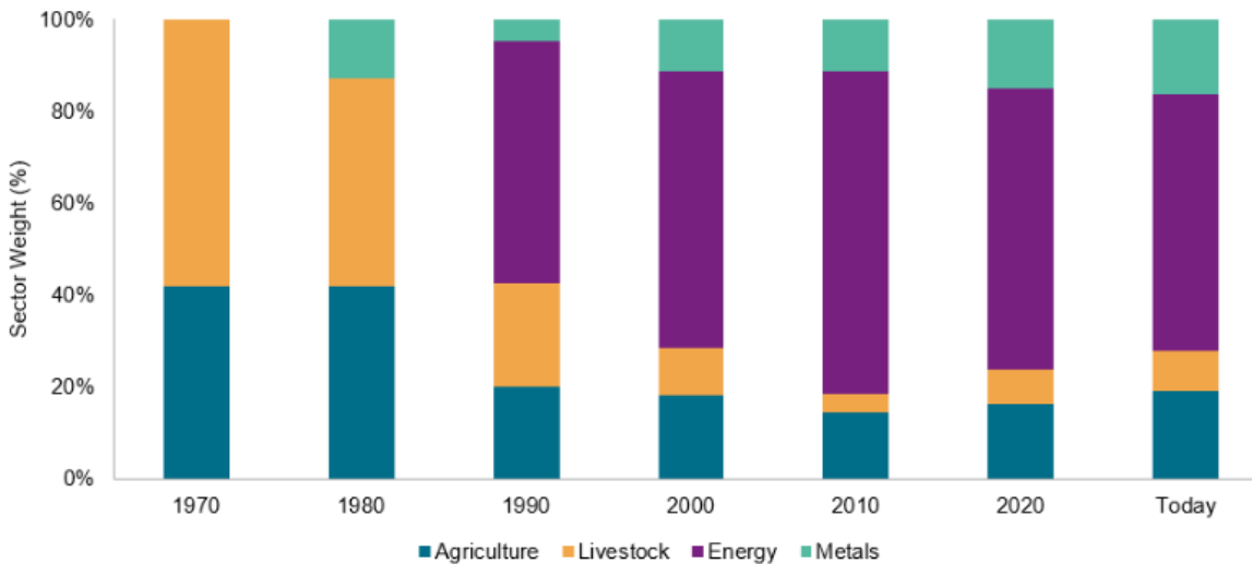
Exhibit 2: Five Decades of Commodity Sector Weights

Data as of June 30, 2023. Chart is provided for illustrative purposes.