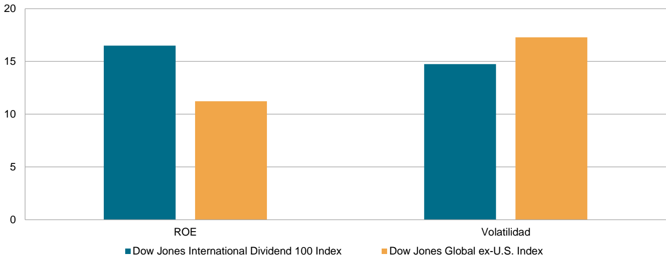
Figura 3: ROE y volatilidad – Dow Jones International Dividend 100 Index contra el benchmark

Datos al 30 de diciembre de 2022. El desempeño pasado no garantiza resultados futuros. Este gráfico posee fines ilustrativos.