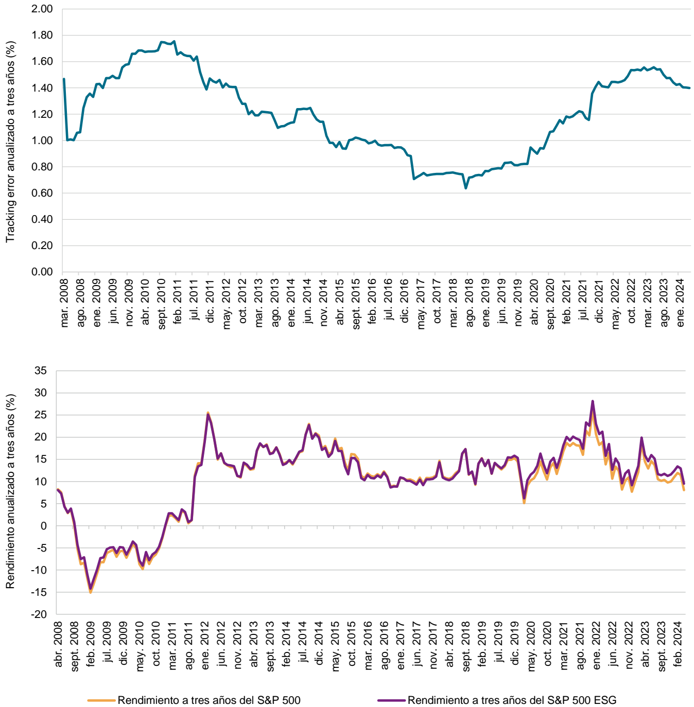
Figura 3: tracking error y rendimiento a tres años del S&P 500 ESG versus el S&P 500

Datos desde el 30 de abril de 2008 hasta el 30 abril de 2024. El desempeño del índice se basa en rendimientos totales mensuales calculados en dólares (USD). El S&P 500 ESG Index fue lanzado el 28 de enero de 2019. Todos los datos previos a la fecha de lanzamiento del índice son datos hipotéticos de pruebas retrospectivas. El desempeño pasado no garantiza resultados futuros. Este gráfico tiene fines ilustrativos y refleja un rendimiento histórico hipotético. Por favor consulte la Divulgación de desempeño al final de este documento para más información sobre las limitaciones inherentes asociadas con el desempeño de pruebas retrospectivas.