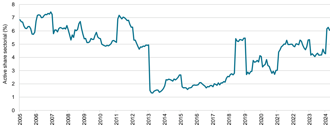
Figura 1: active share sectorial histórico

Fuente: S&P Dow Jones Indices LLC. Datos desde el 29 de abril de 2005 hasta el 30 de abril de 2024. El S&P 500 ESG Index fue lanzado el 28 de enero de 2019. Todos los datos previos a la fecha de lanzamiento del índice son datos hipotéticos de pruebas retrospectivas. El desempeño pasado no garantiza resultados futuros. Este gráfico tiene fines ilustrativos y refleja un rendimiento histórico hipotético. Por favor consulte la Divulgación de desempeño al final de este documento para más información sobre las limitaciones inherentes asociadas con el desempeño de pruebas retrospectivas.