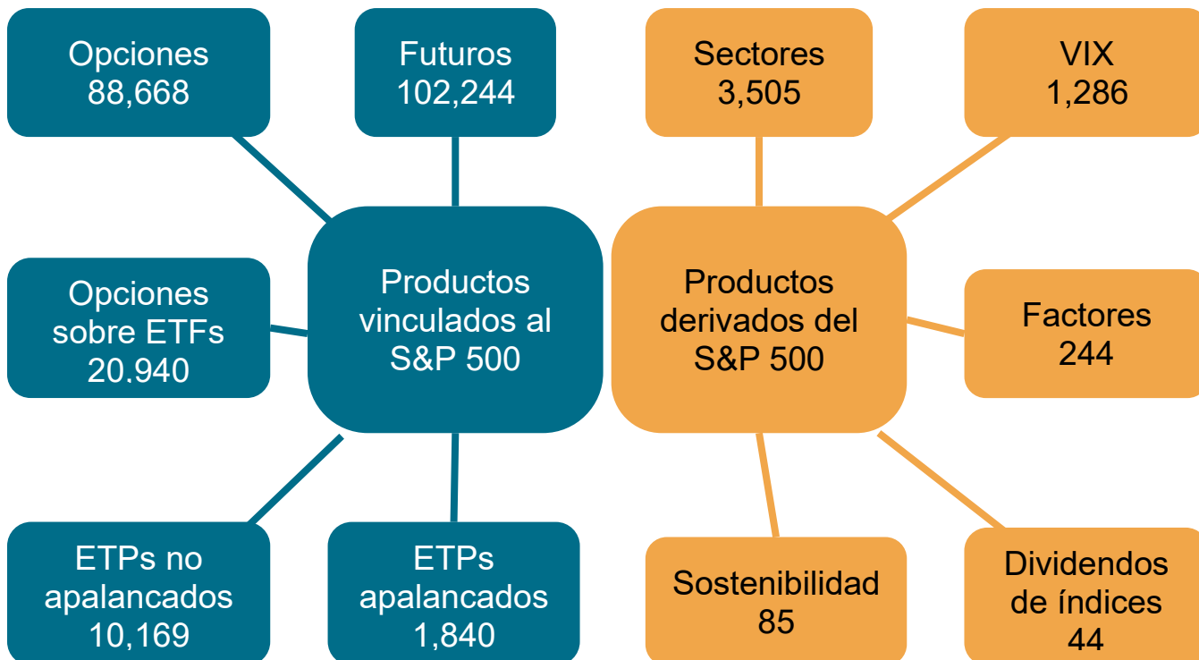
Figura 1: ecosistema del S&P 500 - volúmenes de negociación totales equivalentes al índice 3 (en miles de millones de dólares)

Datos del periodo de 12 meses finalizado el 31 de diciembre de 2023. Este gráfico posee fines ilustrativos.